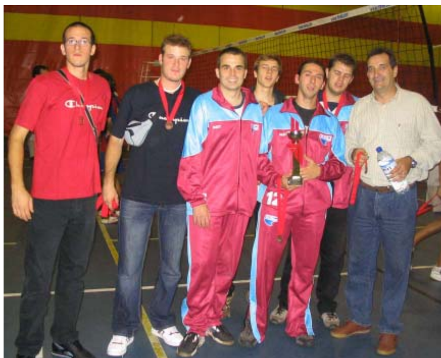
Servette Star - Onex

El F.C.Barcelona es va proclamar campió del torneig. Al Memorial varen acudir la vídua i els seus fills, el President de la Federació i un centenar d'amics i aficionats que varen rendir un sentit homenatge a la seva memòria com a lluitador del Volei Català i un apassionat del nostre esport.