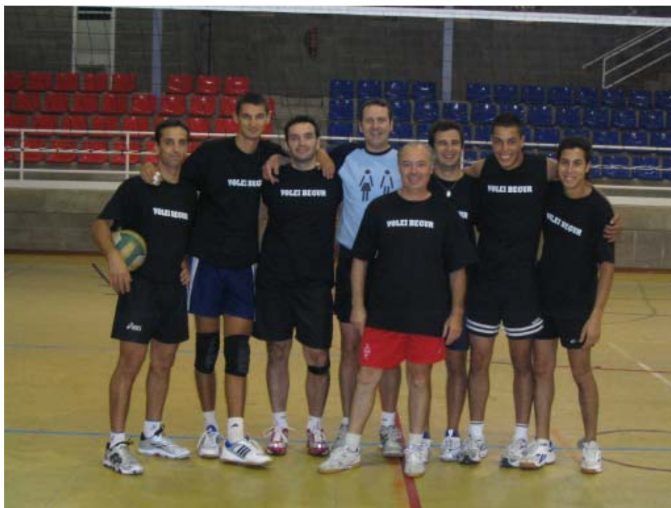
Voleibegur i Volei Tortosa

El passat 17 de setembre es va celebrar a Begur el II Torneig Vila de Begur de Voleibol 4x4. Va comptar amb la participació de 12 equips, procedents la majoria de la província de Girona. Cal destacar la participació de 2 equips de Tarragona, el Acero Bravas Salou i el Volei Tortosa.