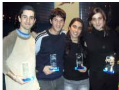
Campions Catalunya platja juvenil