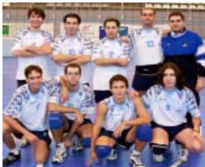
Senior masculí B

Una de les activitats amb més tradició del club es la realització tots els primer de maig de les XII hores de voleibol.