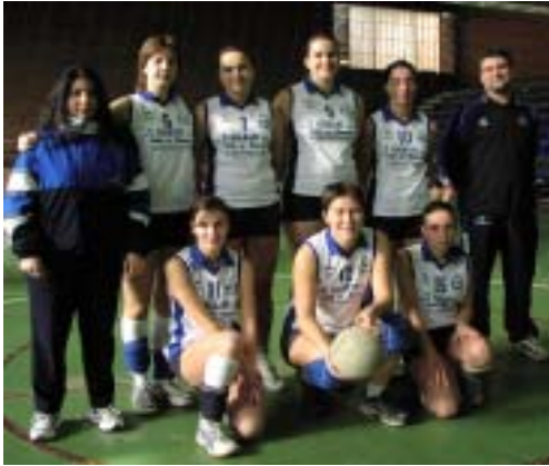
Senior femení A