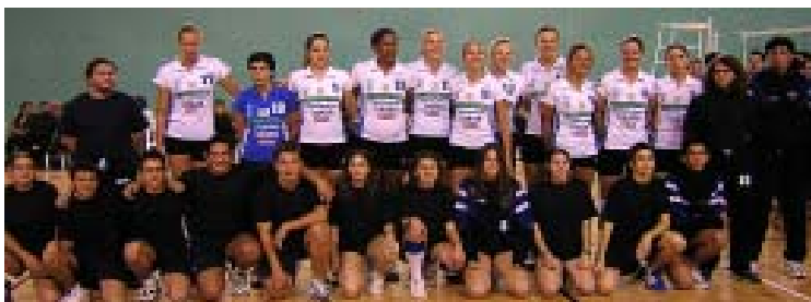
Cadet masculí i femení amb el Tenerife Marichal