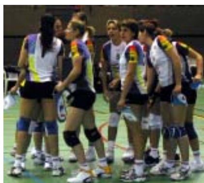
La nostra selecció

L'encontre va ser molt disputat, però la major experiència de la selecció de Moscou (tenien dos jugadores integrants de la seva selecció nacional), no va permetre que les nostres jugadores ens oferís un triomf. El resultat final de l'encontre va ser 1-3 per la selecció de Moscou amb uns parcials de: 16-25/25-21/22-25/22-25.