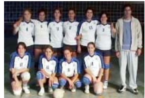
Senior femení B