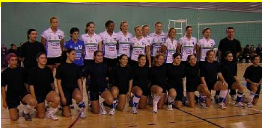
Senior i juvenil femení amb el Tenerife Marichal

El nou pavelló és utilitzat pel Club Voleibol Torrefarrera per disputar els partits i entrenaments dels seus sis equips federats i de l'escola de voleibol escolar que ha engegat aquest any. Un total de 62 jugadors de volei disfruten des de principis d'octubre d'aquesta nova i moderna instal·lació municipal.