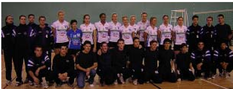
Senior i juvenil masculí amb el Tenerife Marichal