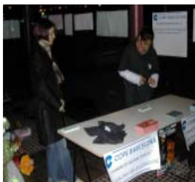
La recollida de joguines

La presència de públic a la grada, tenint present que era un dia laborable, va ser positiva, amb una mica més de 1100 espectadors. Va ser positiu que molts clubs es presentessin en grup i amb ganes d'animar a la nostra selecció. La presència de les cameres de TV3, que donàren en diferit l'encontre, va permetre que molts aficionats poguessin gravar-lo i guardar-lo com a record. Esperem que l'any vinent es continuïn realitzant aquests encontres internacionals i cada vegada siguem més a les grades.