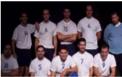
Senior masculí A

El seu equip senior femení te moltes incorporacions, ja que la majoria de les jugadores varem marxar a un altre equip. La directiva del club te moltes esperances en aquest nou grup.