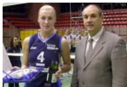
Obsequi a la selecció de Moscou

La recollida de joguines va ser un èxit, ja que molts espectadors es varen adherir a la campanya d'un joguet per una entrada i això va permetre recollir-ne un munt. Aquestes joguines s'han lliurat a la Fundació Antoni Trullà, que porta molts anys realitzant una campanya anomenada «una joguina per un somriure»