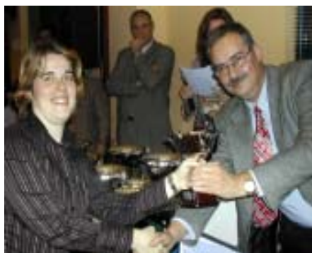
Sr Moure lliura CV Vall Hebrón